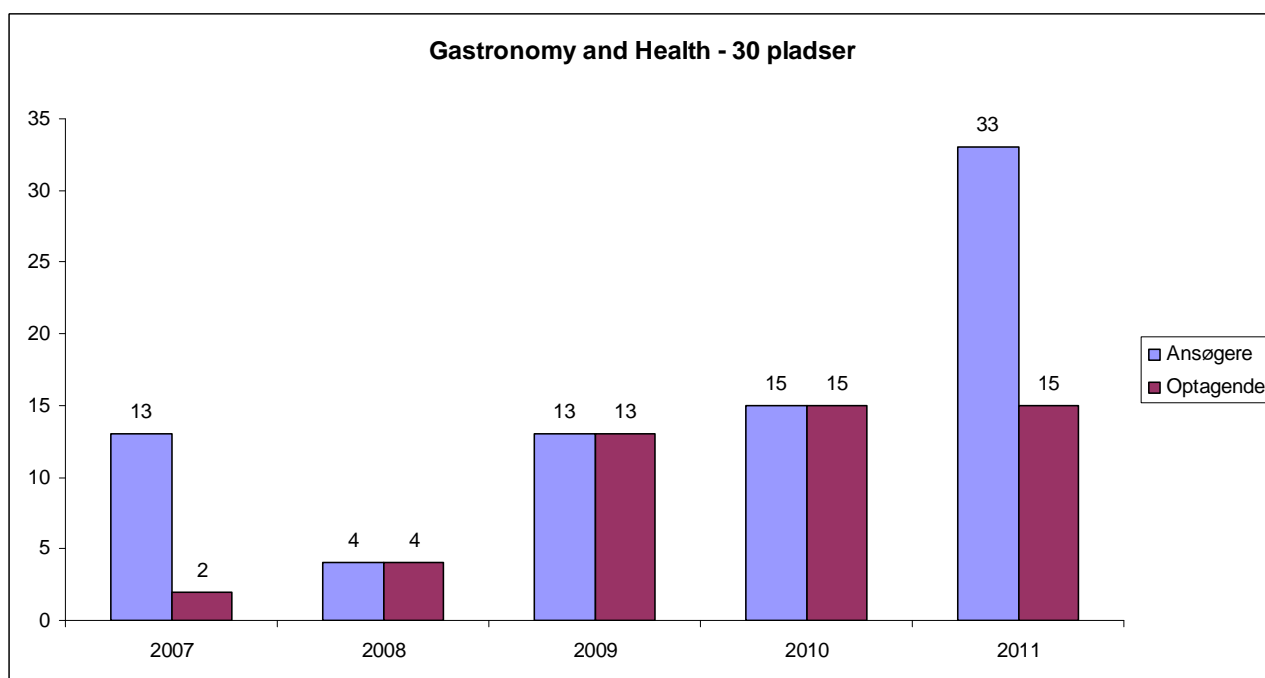
Figur 3: Antallet af ansøgere og optagende på kandidatuddannelsen i Gastronomy and Health for årene 2007-2011. I 2007 og 2008 var der et ubegrænset antal pladser på Gastronomy and Health og suppleringsvar et krav. I 2009, 2010 og 2011 var der 30 pladser på Gastronomy and Health og suppleringsvar kun en anbefaling.